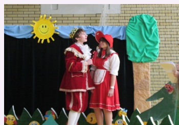
MILI I SYMPATYCZNI

Gimnazjum nr 3 im. Jana Pawła II w Płocku