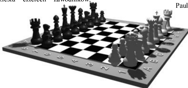
Paulina Niedbała kl. III c

Serdecznie gratulujemy oraz zachęcamy do brania udziału w tych zawodach za rok.